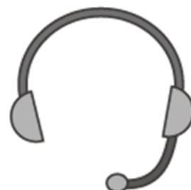
イヤホン・マイク またはヘッドセット