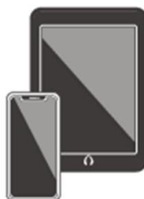
カメラ付きスマホ・ タブレット